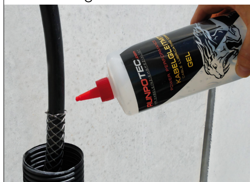
Detailfoto zu Kabelgleitmittel 250 g